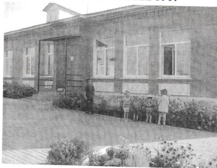
Храпово, 2017 г.