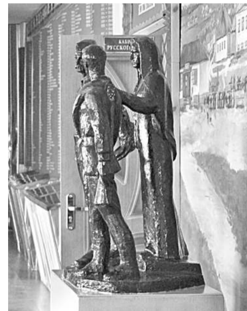
Школьный музей Великой Отечественной войны

Уверена в том, что в школе всегда ведущей и главной должна быть функция воспитания, ответственности за формирование человеческой личности. В детях необходимо формировать нравственные принципы, делая это незаметно и каждодневно. В нашей школе детей и педагогов связывают