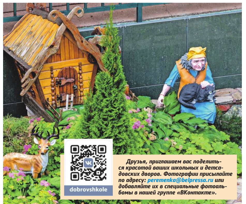
Школа № 41 г. Белгорода