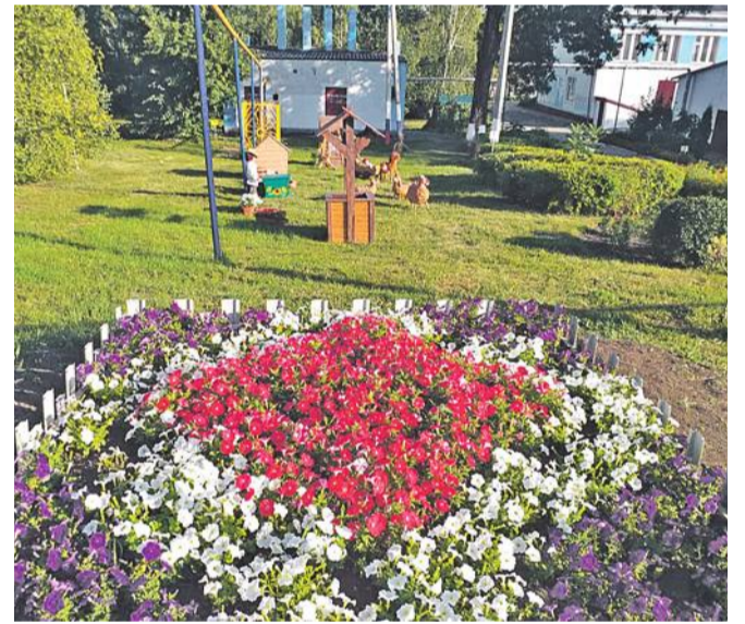
Старобезгинская школа Новооскольского городского округа