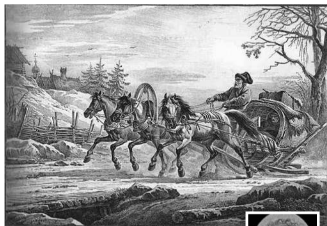
Настоящая кибитка — это крытая повозка, как на этой литографии Александра Орловского «Путешественник в кибитке, или Сани, запряжённые тройкой» (1819, Киевская картинная галерея)

Другие ученики назвали кибитку «птичкой», летящей с Кубы и крыльями поднимающей снег; «поездом, который очень быстро едет, и поэтому снег летит вверх и вниз» и даже «кибернетической, шустрой тёткой». Ямщик, по их мнению, оказался «дядей, профессия которого — таскать ящики»; человеком, роющим ямы, вероятно, карликом, «потому что сидит на чём-то маленьком и прячется в ямку».