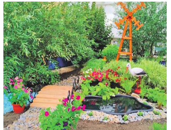
Рождественская школа Валуйского городского округа