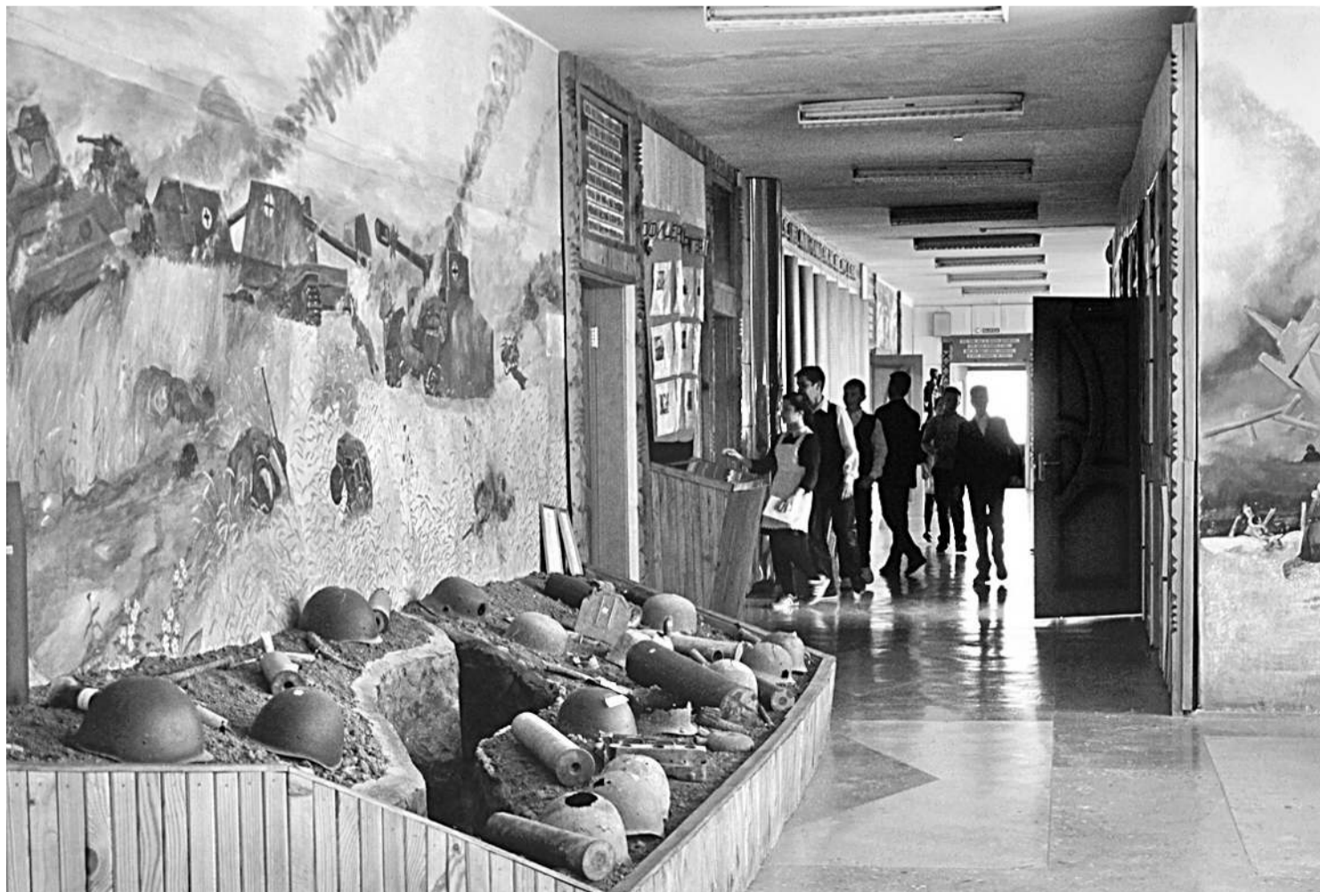
Школьный музей Великой Отчужденной войны