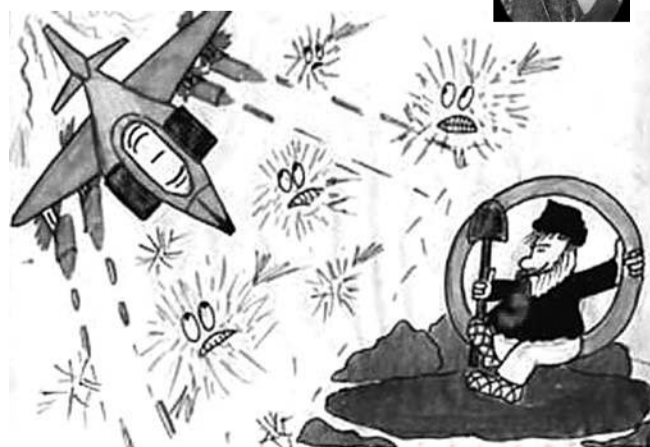
А вот таким детским «видением» браздов, ямщика и кибитки делятся друг с другом пользователи Интернета