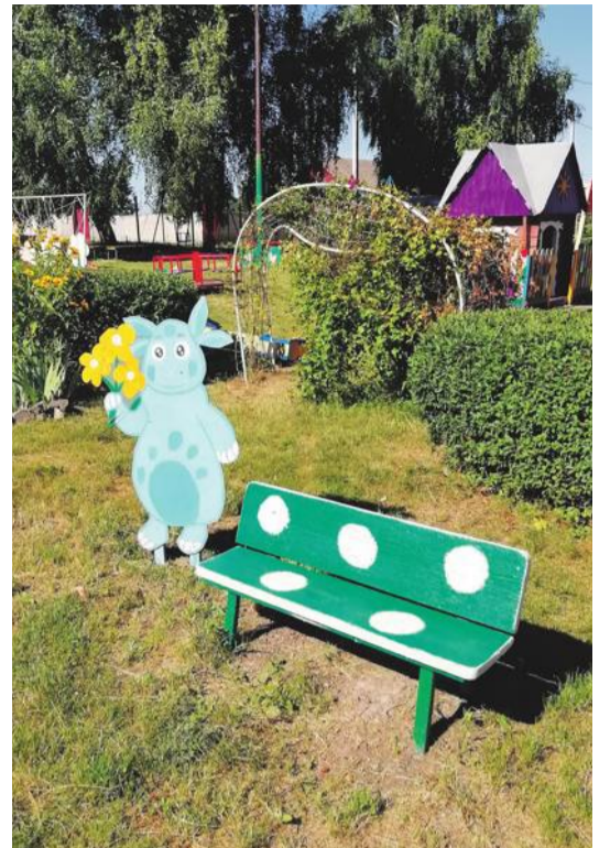
Детсад № 4 с. Алексеевка Корочанского района