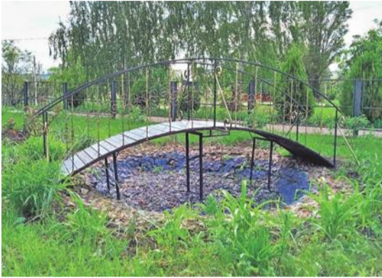
Уразовская школа № 2 Валуйского городского округа