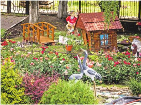
Школа № 41 г. Белгорода