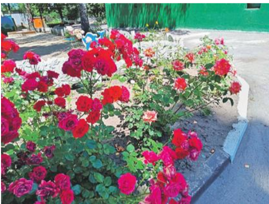
Детсад № 48 «Вишенка» г. Белгорода