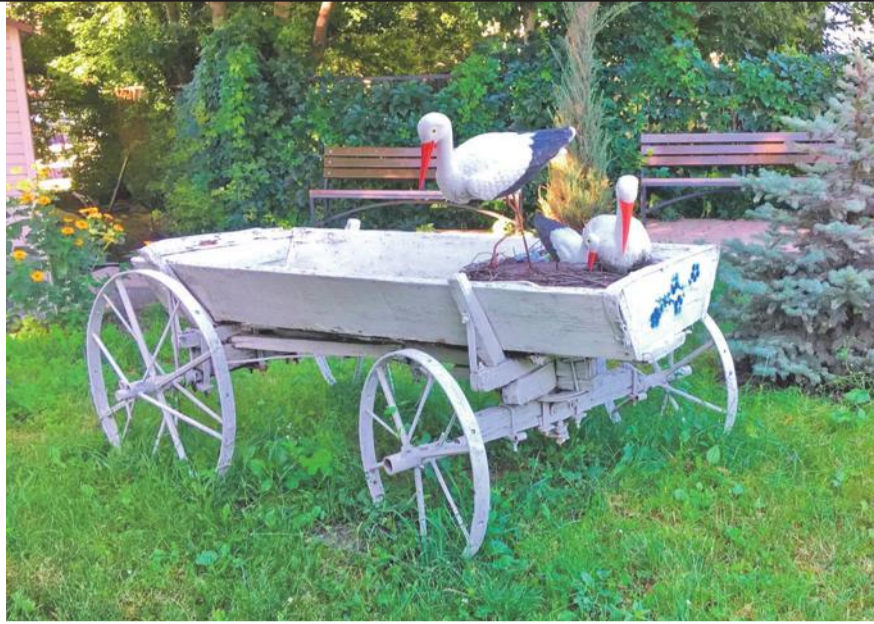
Центр образования № 1 г. Белгорода