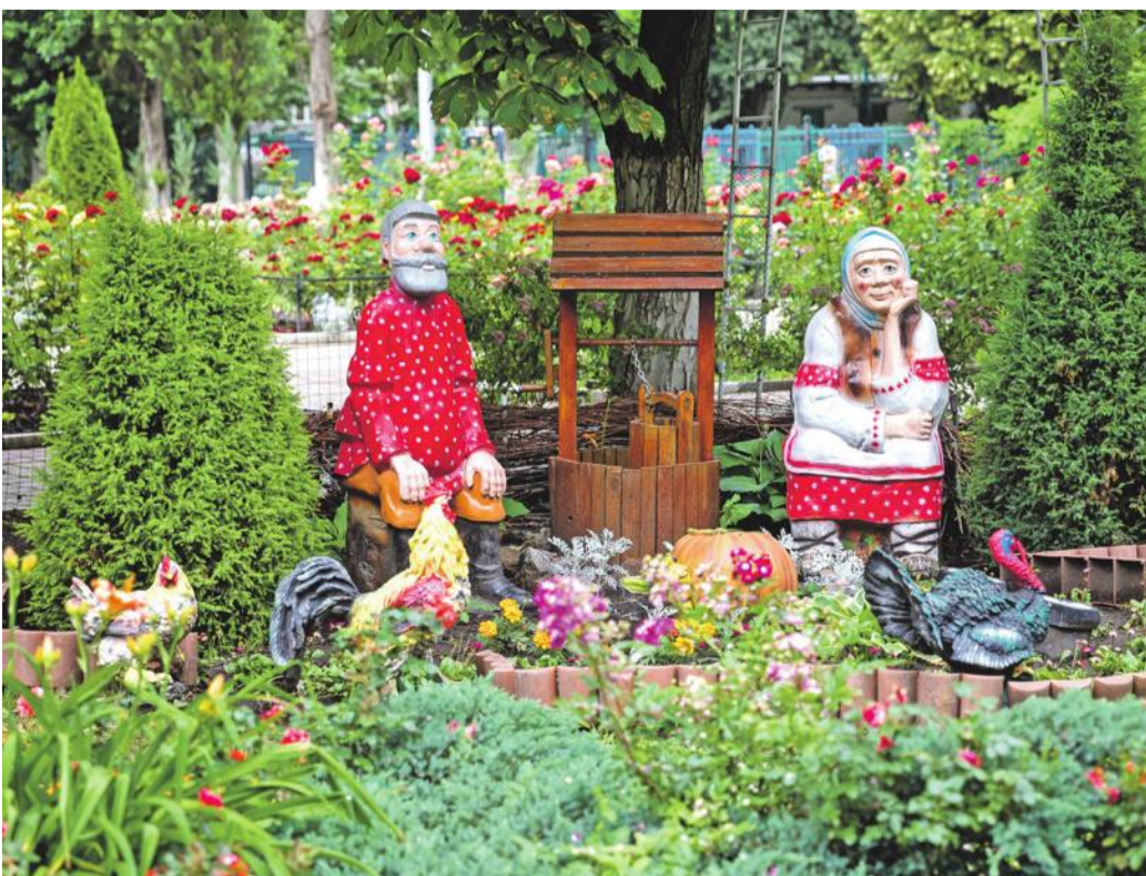
Школа № 41 г. Белгорода