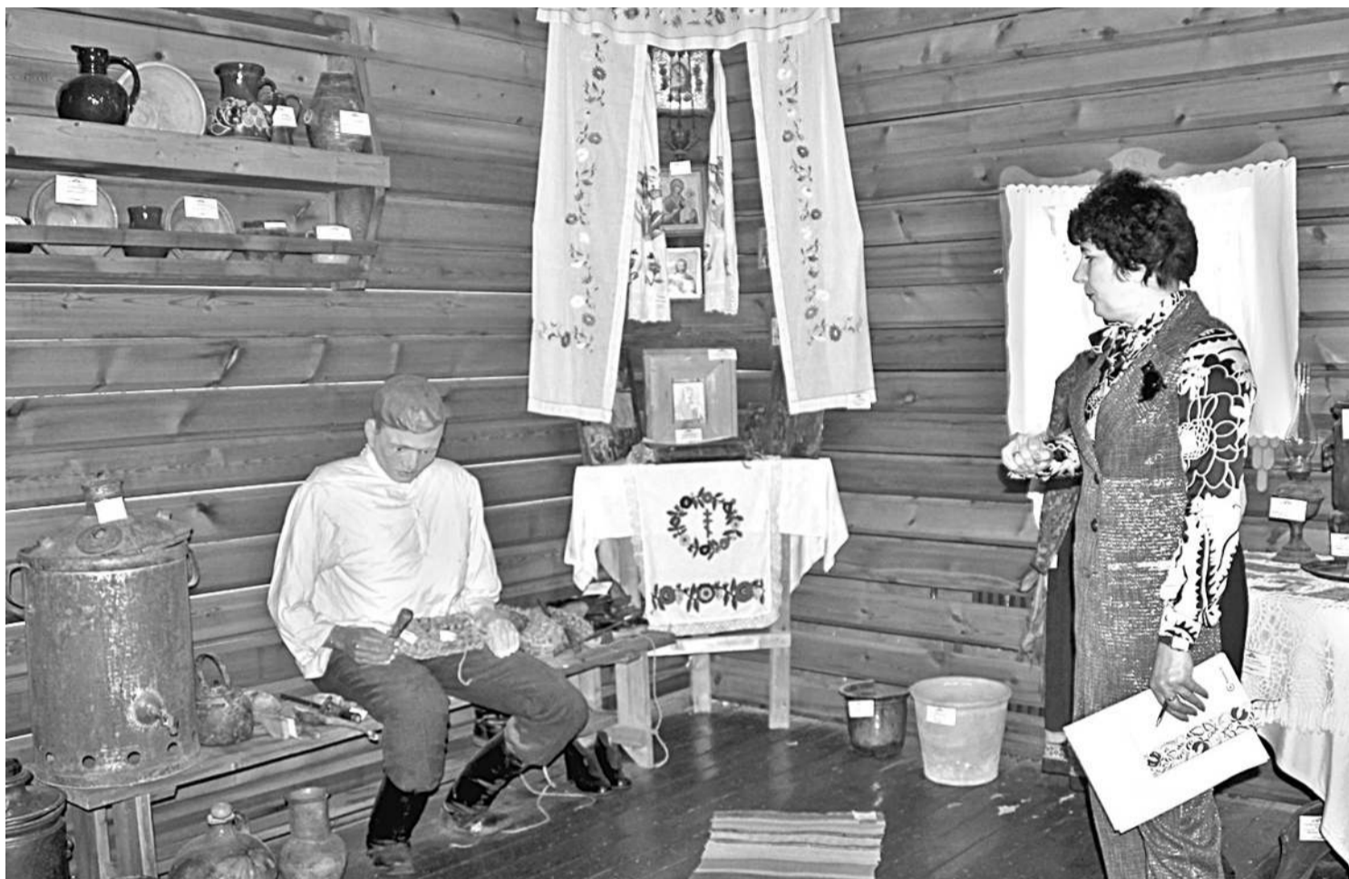
В школьном музее этнографии

НО ДАЖЕ САМОЕ КРАСИВОЕ, ПУСТЬ И ДОБРОЖЕЛАТЕЛЬНОЕ ОФОРМЛЕНИЕ МОЖЕТ СТАТЬ БЕСПОЛЕЗНЫМ, БЕЗДЕЙСТВЕННЫМ,