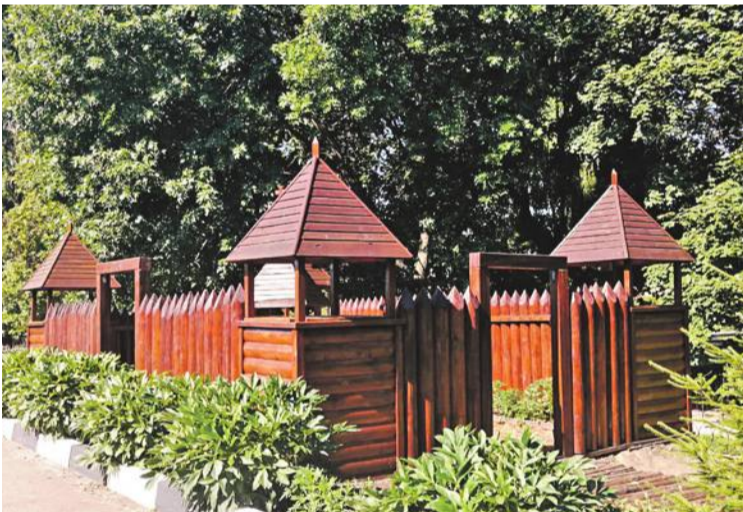
Школа № 4 г. Валуйки

Школа начинается со школьного двора. От того, как он обустроен, зависит многое. Настроение ребят и учителей. Их желание идти в школу. Адаптация первоклассников к учебной жизни. Недаром на Белгородчине уже много лет проводят конкурсы на лучшее обустройство школьных территорий. Если к делу подойти с душой, то школьный двор можно превратить и в ботанический, и в сказочный сад, и в обучающее пространство. В группе «Доброжелательная школа Белогорья» в соцсети «ВКонтакте» мы попросили учителей и учеников поделиться с редакцией фотографиями дворов их школ. И детских садов. Давайте вместе полюбуемся на нашу школьную красоту! Ну и в нашем редакционном портфеле кое-что нашлось.