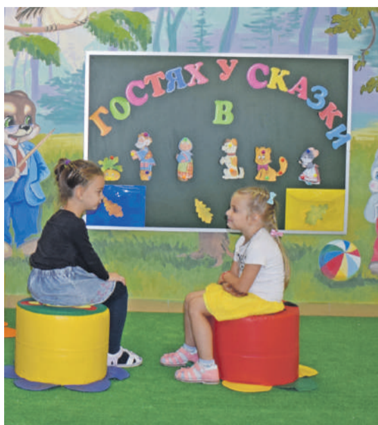
В детском саду № 4