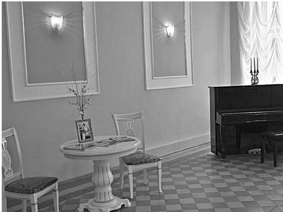
Ольгинский зал школы № 1