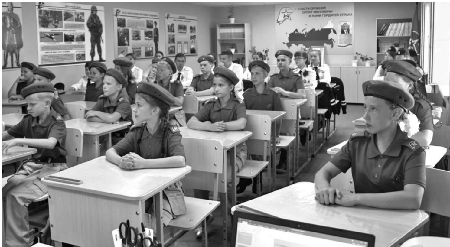
Кадетский класс школы № 1

В результате реализации проекта в школе создали лабораторию, которую можно без преувеличения назвать кузницей пытливых, талантливых юных исследователей. Ученики от четвёртого до выпускного классов занимаются наукой. В рамках постпроектной деятельности рядом с лабораторией оформлена развивающая зона «Химия занимательная и увлекательная», которая рассказывает об опытах,